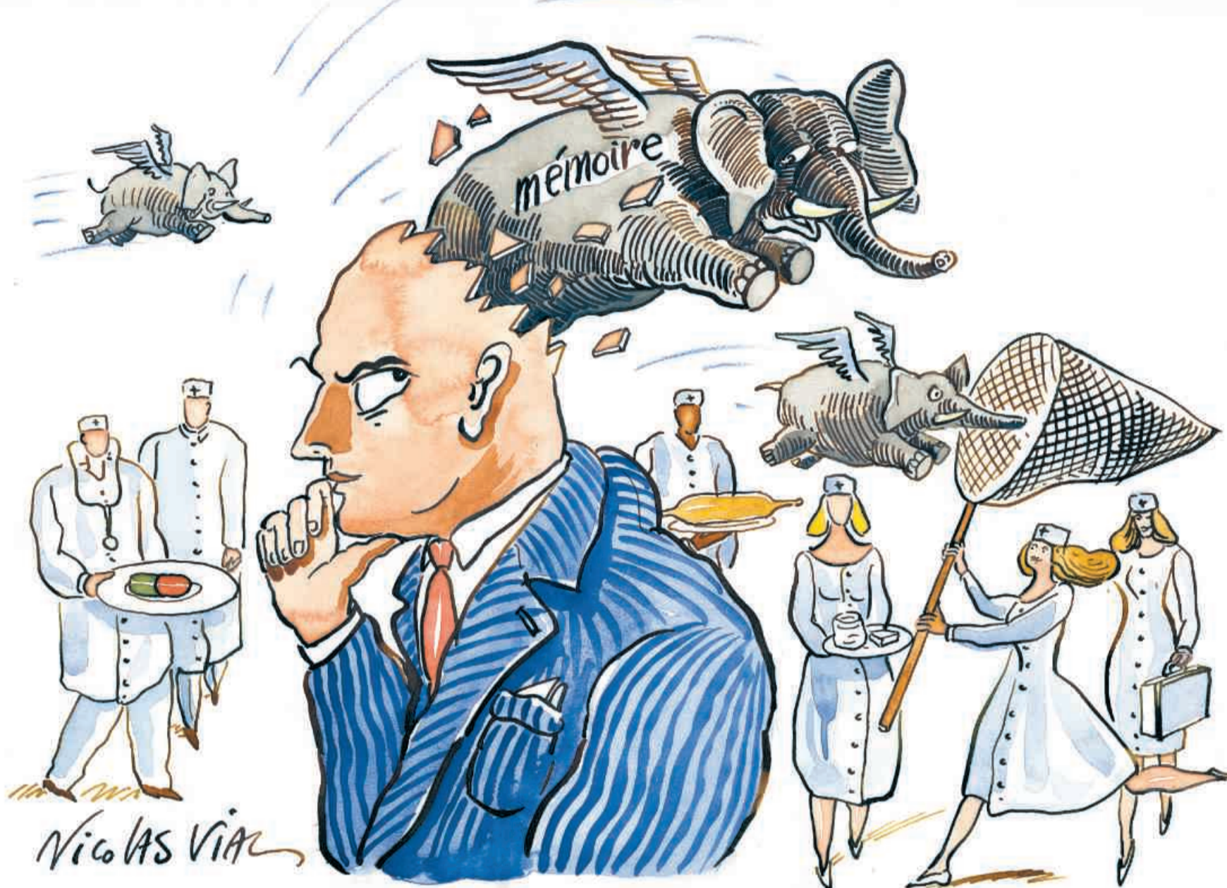
Les dépenses en «traitements Alzheimer» ont presque quadruplé dans le monde

« Les maladies du système nerveux central comme les migraines, la schizophrénie, Parkinson et surtout Alzheimer représentent le deuxième marché du médicament, derrière les maladies cardio-vasculaires et devant le cancer », constate Phi-